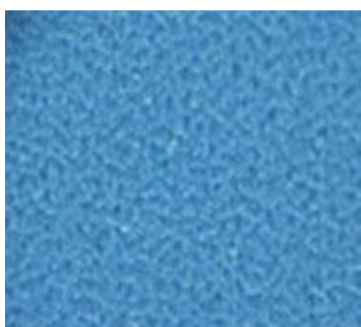
Вид рабочей поверхности

Полотно серии JBC Printer Pro 7801 WEB специально разработано для ролевой печати Heatset и Coldset (с горячей сушкой и без сушки), для средне- и высокоскоростной печати. Полотно обладает превосходной устойчивостью к продавам и быстрым восстановлением.